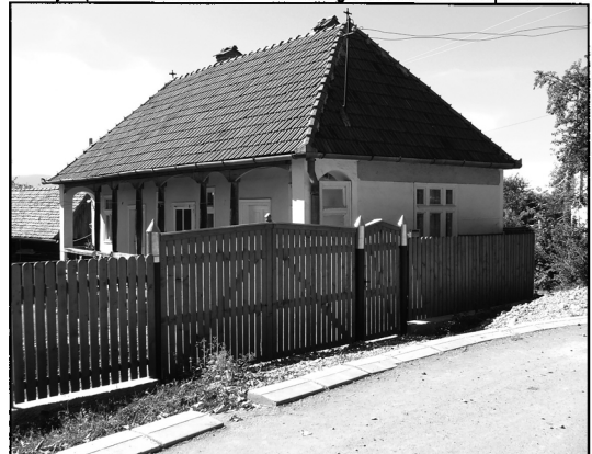
további fotók azonosítói nr.identificare fotografii anexate