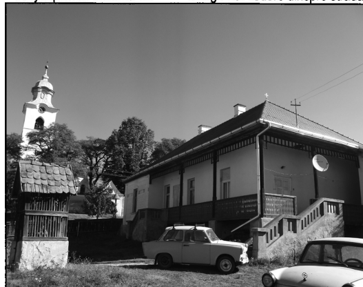
további fotók azonosítói nr.identificare fotografii anexate