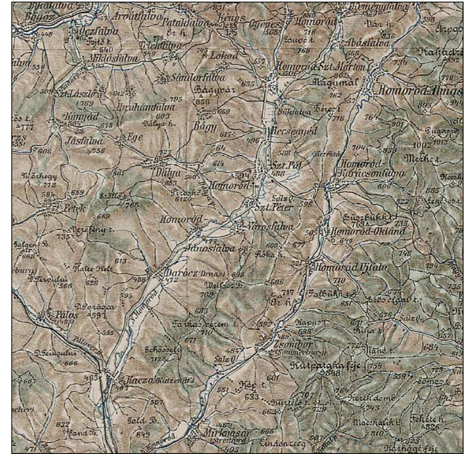
III. KATONAI FELMÉRÉS -1910 AL TREILEA CARTARE MILITARĂ