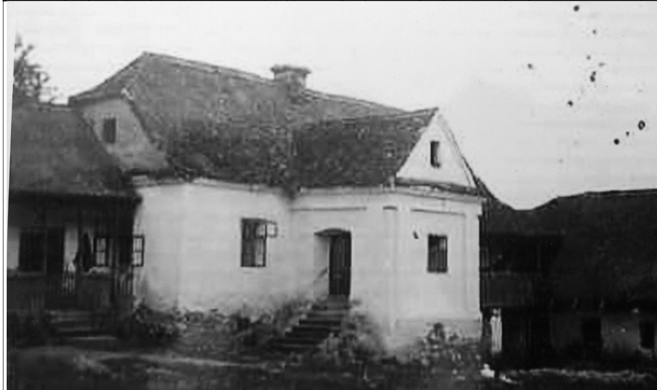
Régi arhív fénykép