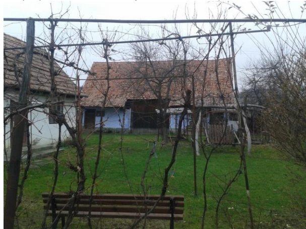
Fénykép utca felőli nézet / foto: vedere dinspre stradă