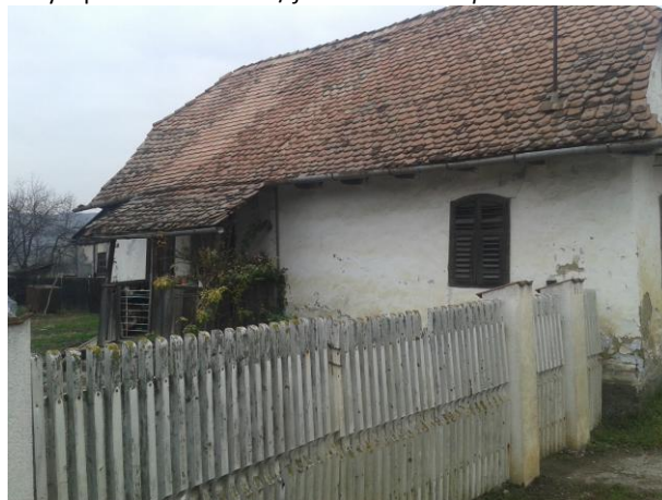
Fénykép utca felőli nézet / foto: vedere dinspre stradă