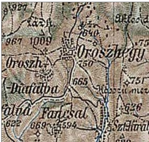
Detaliu din a treia hartă militară austriacă, 1869-73

Satul ocupa cca. 70 % din suprafața actuală a intravilanului și existau deja cele două subunități.