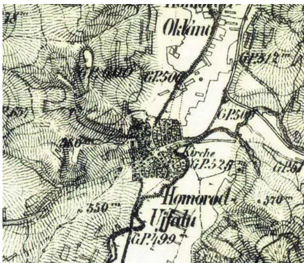
detaliu din a două cartare austriacă 1819 – 1869

De-a lungul timpului specifice satului erau gospodariile familiale mari, care pe parcursul timpului s-au împartit si au devenit gospodarii mici, care la rândul lor se despicau mai departe pe baza de rudenii. Gospodăriile inițiale se poate încă regăsi în zona centrală a satului caracteristice printr-o ocupare a terenului mai liber, generând o structură stradală adunată. Dezvoltările mai noi față de această fază se încadrează într-o structură cu parcelar tip bandă înșiruite de-alungul străduțelor care se ramifică din acest miez.