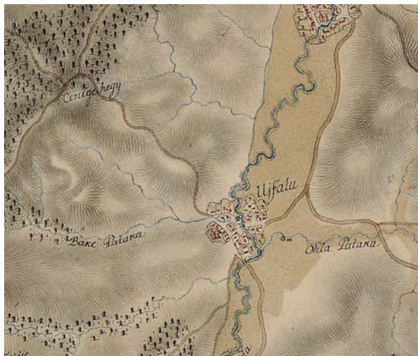
detaliu din Harta Iosefină 1769 – 1773

De obicei configuratia unui sat depinde de asezarea geografica a localitatii, de nevoile sociale si economice ale locuitorilor. Satul este definit de starzi, parcele, poteci, vecinatati...cea ce creaza o imagine de ansamblu a satului, cu momentele sale specifice. Astfel s-a dezvoltat o imagine de sat, care este influentat si definit istoric. O alta caracteristica a satului era împartirea militara, care a fost definit pe baza teritoriului si a numarului de militari (capi de gospodarie). Astfel si în denumirile actuale putem încă observa împartirea inițială a satului denumite ca "szegek" sau "tizek".