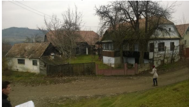
Fénykép utca felőli nézet / foto: vedere dinspre stradă