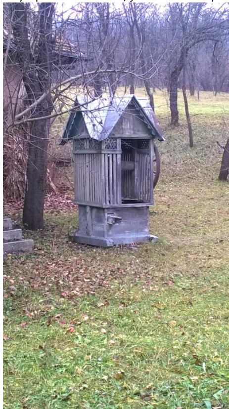
További fotók azonosítói / nr. Id. Fotografii anexe