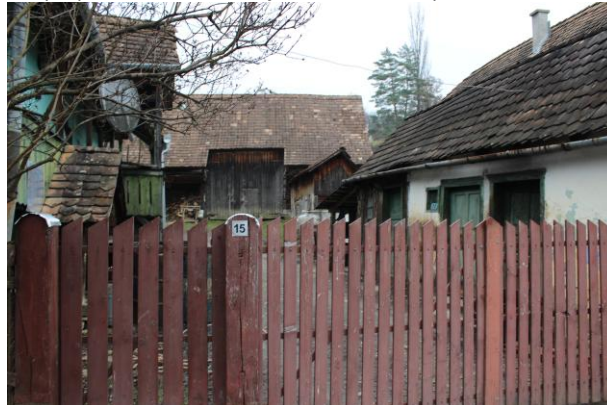
Fénykép utca felőli nézet / foto: vedere dinspre stradă