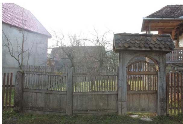
További fotók azonosítói / nr. Id. Fotografii anexe