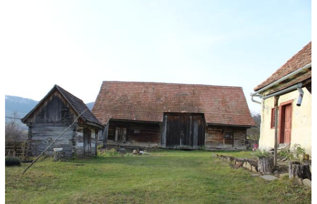
Fénykép utca felőli nézet / foto: vedere dinspre stradă