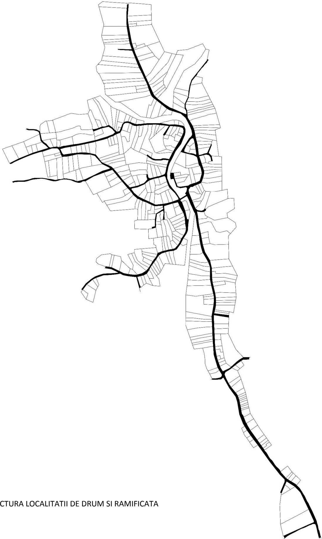
STRUCTURA LOCALITATII DE DRUM SI RAMIFICATA