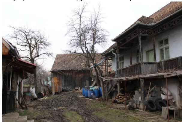
Fénykép utca felőli nézet / foto: vedere dinspre stradă