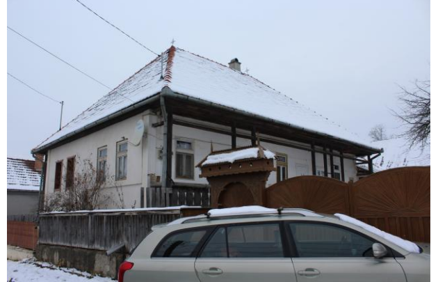
Fénykép utca felőli nézet / foto: vedere dinspre stradă