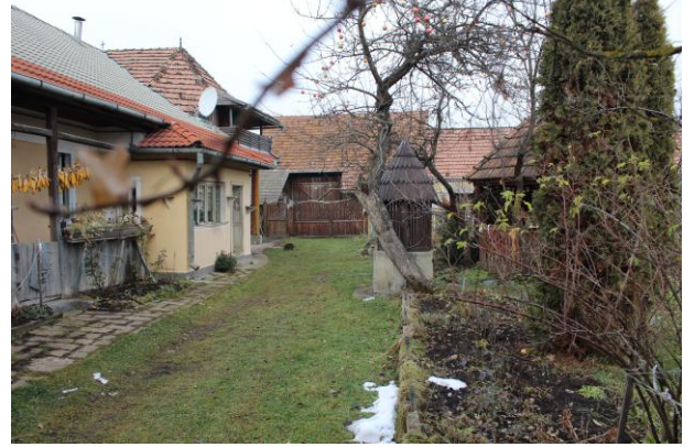
Fénykép utca felőli nézet / foto: vedere dinspre stradă