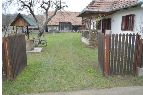
Fénykép utca felőli nézet / foto: vedere dinspre stradă