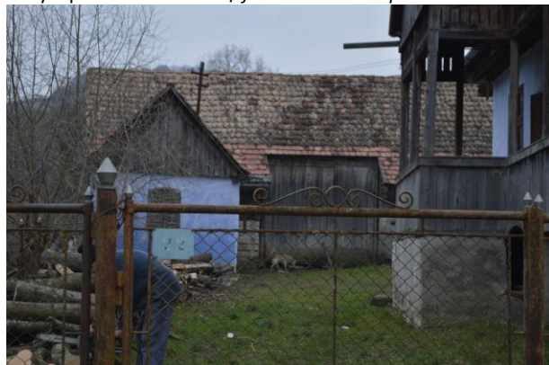
Fénykép utca felőli nézet / foto: vedere dinspre stradă