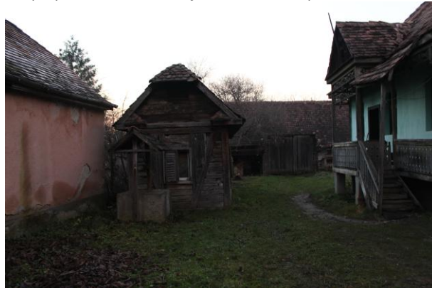
Fénykép utca felőli nézet / foto: vedere dinspre stradă