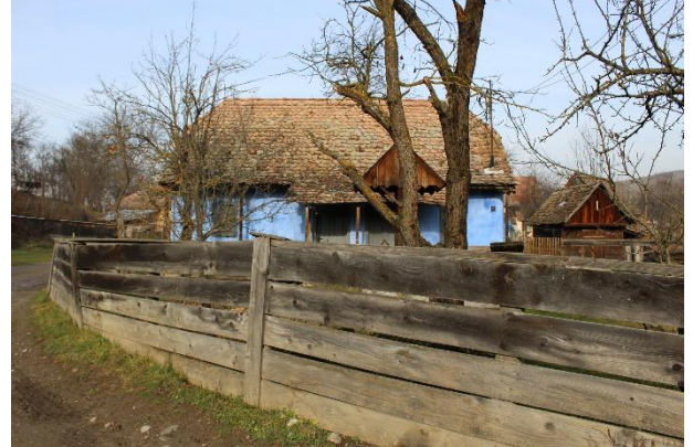
Fénykép utca felőli nézet / foto: vedere dinspre stradă