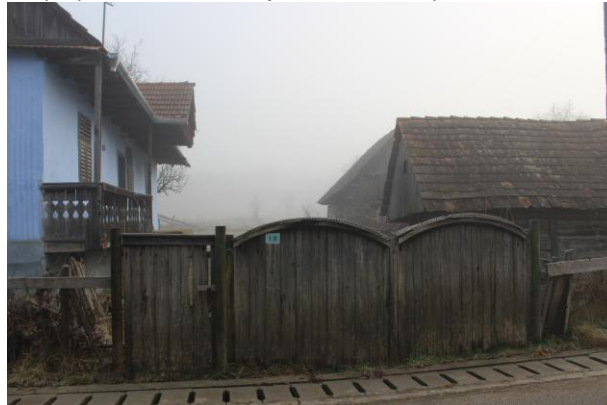
Fénykép utca felőli nézet / foto: vedere dinspre stradă