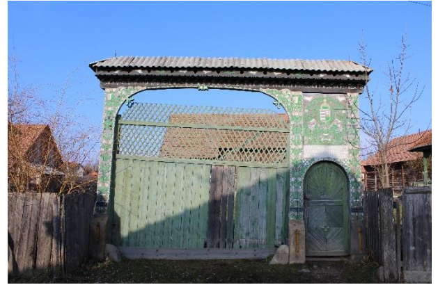
Fénykép utca felőli nézet / foto: vedere dinspre stradă