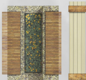
PLAN SC. 120