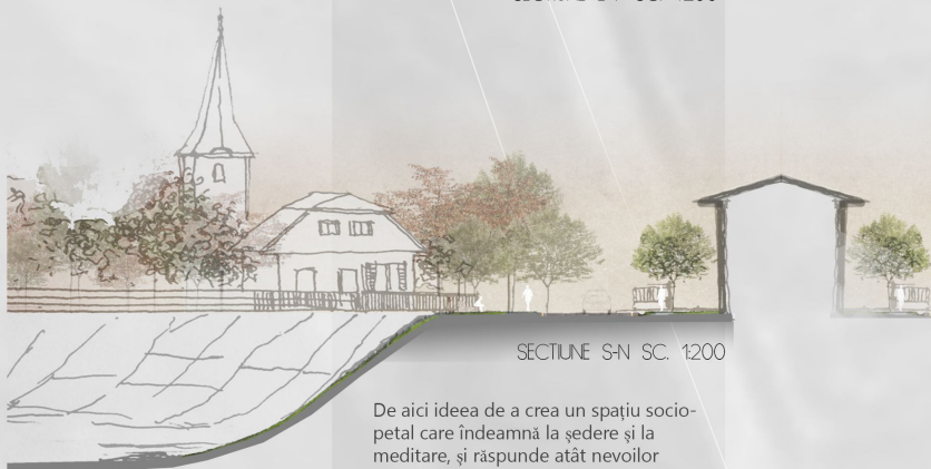
SECȚIUNE S-N SC. 1200

De aici ideea de a crea un spațiu socio-petal care îndeamnă la ședere și la meditare, și răspunde atât nevoilor colective, cât și celor individuale, prin inserarea unor retrageri de relief. În continuarea acestei idei, am propus și reamenajarea zonei de mal a pârâului Kűsműd.