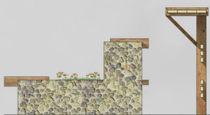
VEDERE LATERALA SC. 120