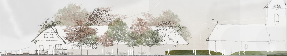
SECȚIUNE E-V SC. 1200

Prin cultivarea resurselor locale și păstrarea centrului spiritual, adică a valorilor care îl țin unit. Vatra satului este situată aproximativ în centrul geometric și concentrează principalele clădiri reprezentative. Proiectul își propune reafirmarea acestui centru prin crearea unei zone publice versatile care funcționează ca spațiu de evenimente pentru comunitate.