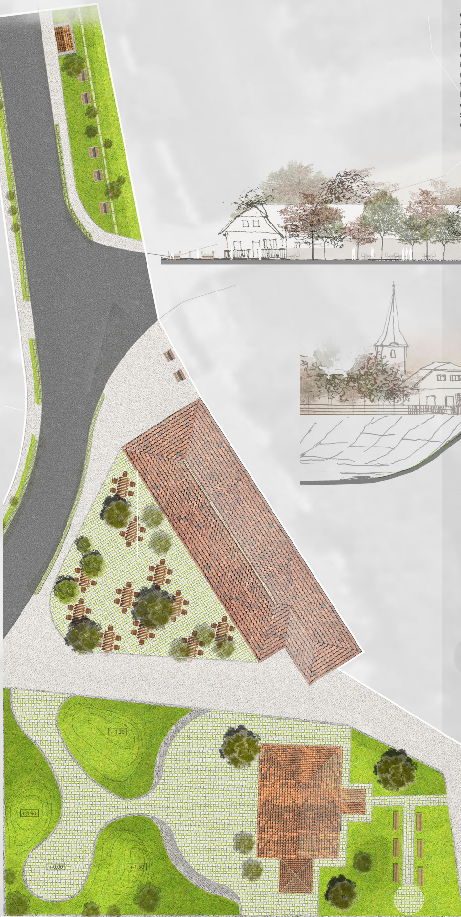
PLAN SITUATE SC. 1200