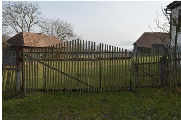
Fénykép utca felőli nézet / foto: vedere dinspre stradă