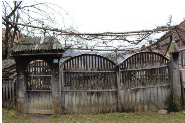
Fénykép utca felőli nézet / foto: vedere dinspre stradă