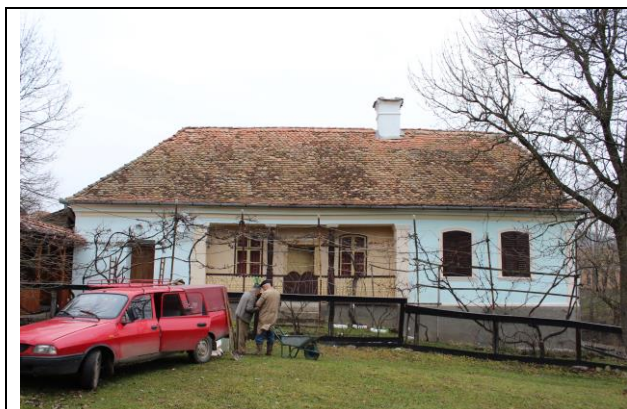
Fénykép utca felőli nézet / foto: vedere dinspre stradă

További fotók azonosítói / nr. Id. Fotografii anexe