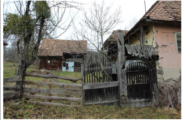
Fénykép utca felőli nézet / foto: vedere dinspre stradă