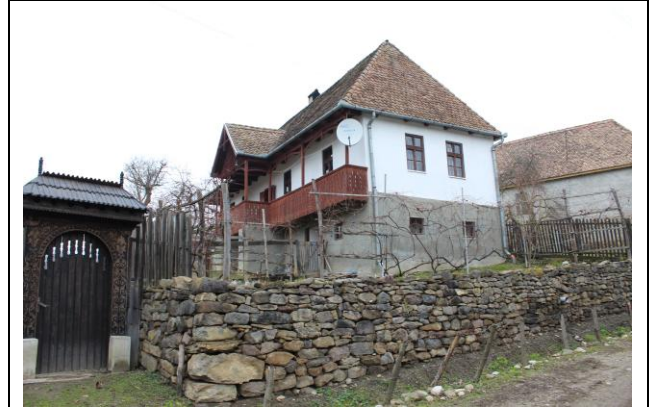
Fénykép utca felőli nézet / foto: vedere dinspre stradă

További fotók azonosítói / nr. Id. Fotografii anexe