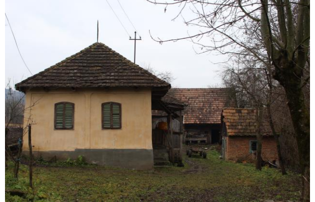
Fénykép utca felőli nézet / foto: vedere dinspre stradă